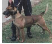
BRN 14265 | Tessa (Dhr. B. Hendrikkx, Lage-Miede)

PH I 438 CL (Dhr. P.M.T. Sommers, Ulf)ft