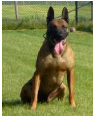
BRN 17064 | Rico (Dhr. E. Vergossen, Koningsbosch)